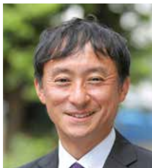
全国公立学校教頭会 会長