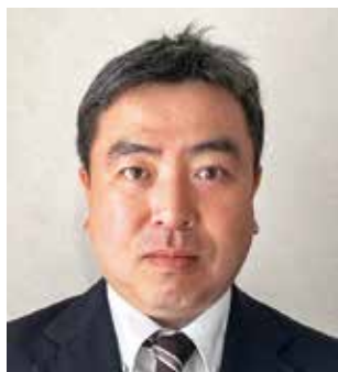
札幌大会 実行委員長

教育は全国統一で同じ内容を扱いますが、地域や学校の現状は大きく異なり、そこから浮かび上がる課題も多様です。本大会において各地の実践報告や研究成果を共有し、互いに研鑽を深めることで得られる知見は、必ず各校の教育活動に生かされるものと考えております。また、全国の同職の仲間と語り、課題を分かち合うことは、一人職が多い私たちにとって心強い支えとなると感じております。会員の皆様の積極的なご参加をお待ちしております。